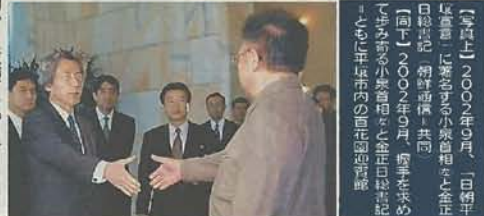
「署名しなかった」2002年9月、日朝首脳会談で握手する小泉首相と金正日総書記。初対面は共同。同日、金正日首相と金正日総書記...