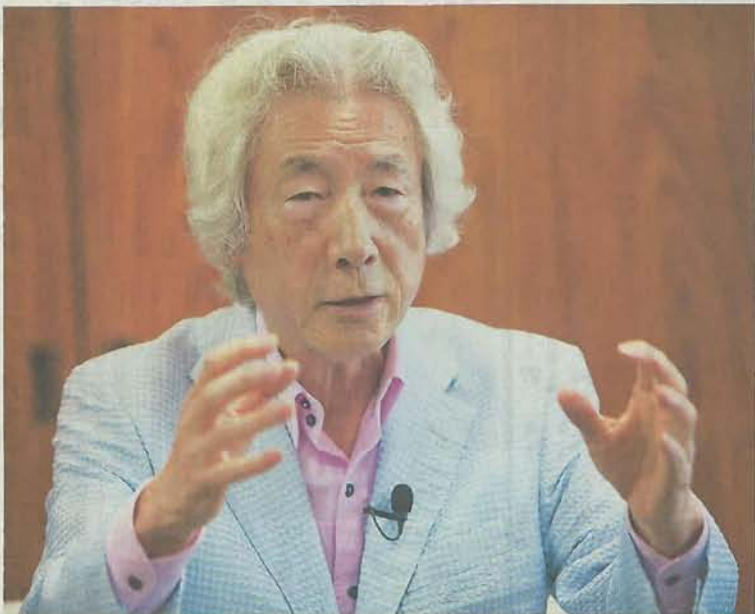
「日朝関係の経過と小泉氏の歩み」