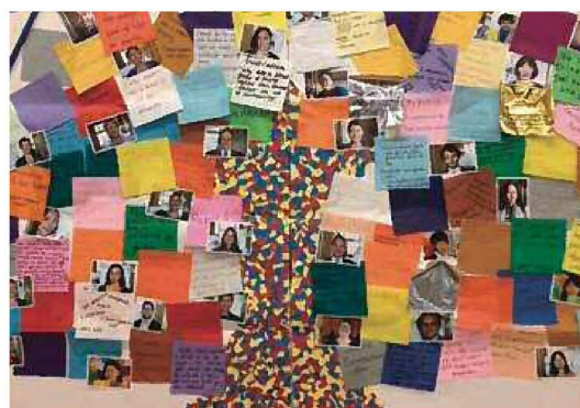
作成したアート作品「希望の木」